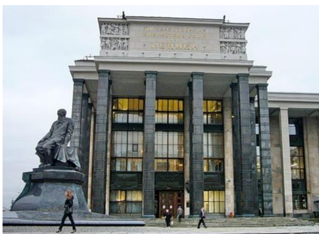
Российская государственная библиотека

ул. Воздвиженка, дом 3/5, корпус «Г», подъезд 3 (станция метро «Арбатская», «Боровицкая»)