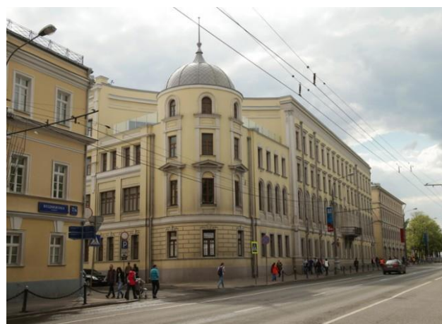
Центр развития межличностных коммуникаций

ул. Воздвиженка, дом 3/5, корпус «Г», подъезд 3 (станция метро «Арбатская», «Боровицкая»)